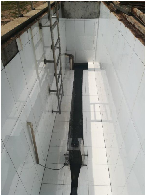
图 2 企业总排口照片